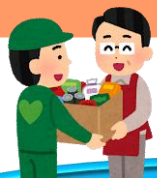
フードバンクみなのわ事業 イメージ図

フードバンクとは、企業で廃棄されたりご家庭に眠っている食料を回収し、生活困窮者や地域支援活動に取り組む団体に寄付する活動です。